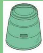
堆肥化容器（コンポスト）

堆肥化容器（コンポスト）の無償貸与 ●八丈町では生ごみの減量化を図るため、堆肥化容器（コンポスト）の無償貸与を実施しています。 ※1世帯につき、2基まで申請できます。 ※貸与期間は、3年間です。（貸与期間経過後は、譲渡となります。） ※容器の大きさは、130L（高さ660mm、直径600mm）と230L（高さ716mm、直径800mm）の2種類です。 ●申請は、町役場住民課環境係（1階4番窓口）・各出張所で受け付けています。