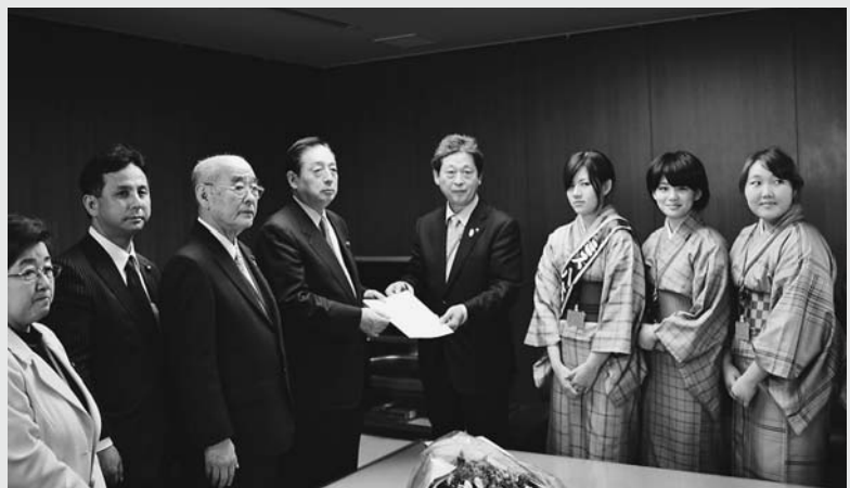
国交大臣への要望

航空運賃の値上げが八丈町の経済に及ぼす影響を懸念し、町長と議員全員で、太田国交大臣に会った。観光や医療への影響など島の苦しい事情を訴え、離島航空路への支援を求めた。 同日午後、町長と議員全員で全日空本社を訪ね、島の厳しい現状を訴えた上で、今後も交渉できる関係の維持と航空運賃の値下げや観光客誘致策を要望した。