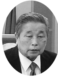
山下 松邦 議員