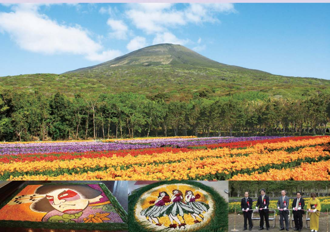
第48回八丈島フリージアまつり フリージア・インフィオラータ

議会だよりは八丈町のホームページでもご覧いただけます http://www.town.hachijo.tokyo.jp/gikai/gikai_dayori/gikai_dayori.html