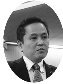
山下 崇 議員