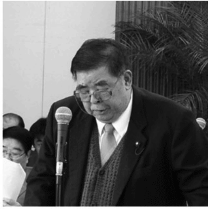
菊池 孜行 議員