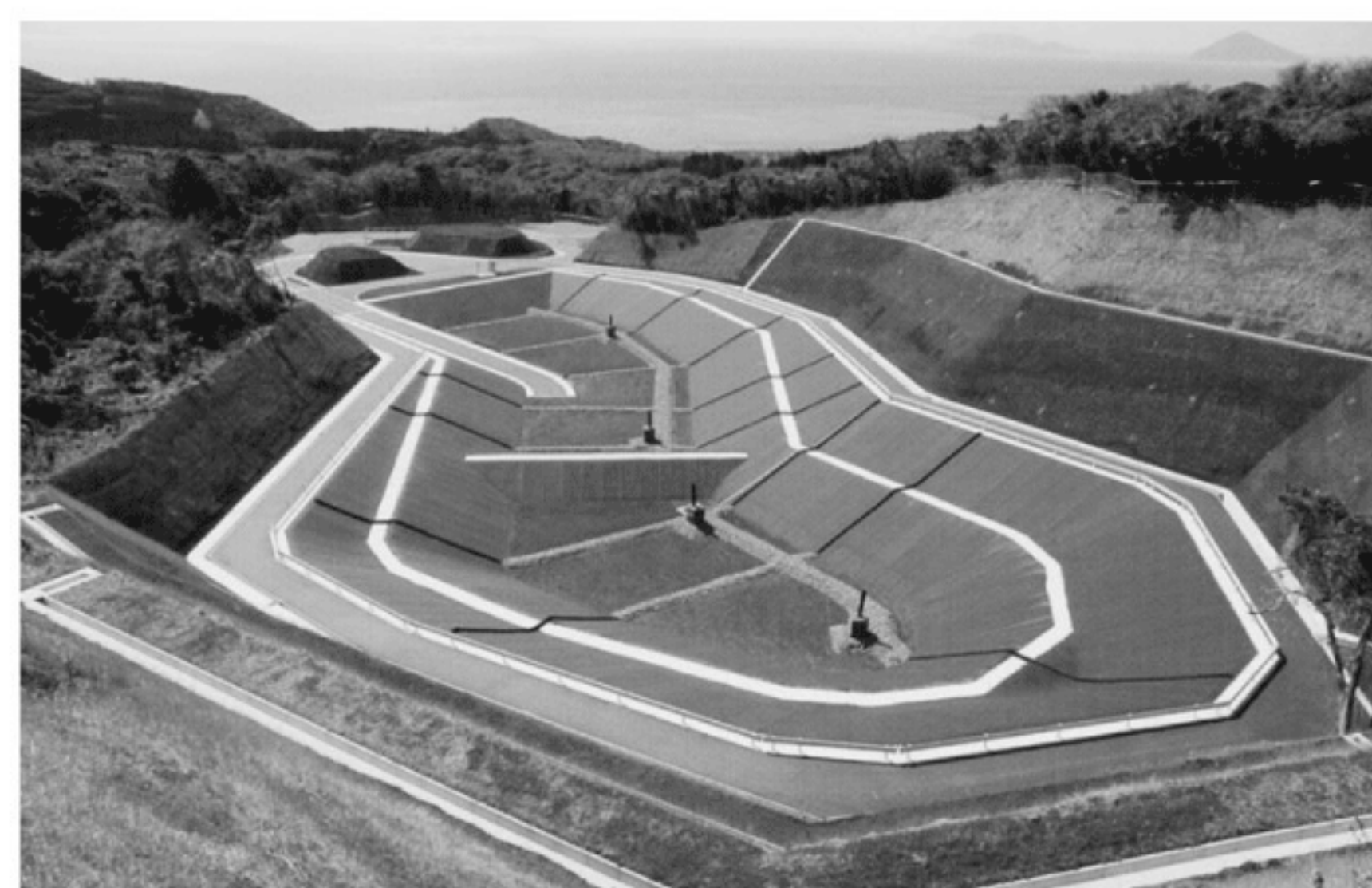
大島一般廃棄物管理型最終処分場