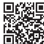
本校ホームページ