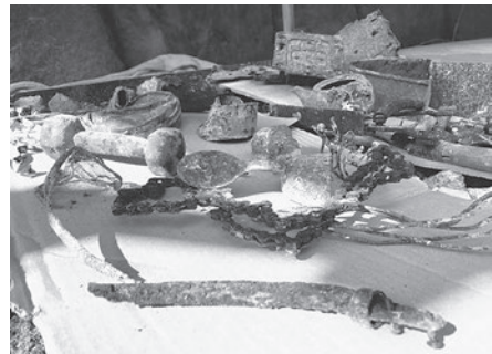
のこぎりの刃、スプーン、急須など