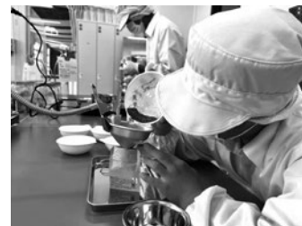
作業学習：食品加工の取組

※詳しくは本校ホームページや分教室X（旧Twitter）で確認いただくか、電話にて問い合わせください。申込み切は各回の3日前まで。