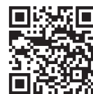
外来生物法とは？ (環境省HP)