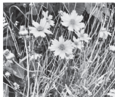
オオキンケイギク (6月に撮影)

また、6月1日よりアカミミガメとアメリカザリガニが条件付特定外来生物に指定され、放流や販売が禁止されています。 外来生物の対策は「入れない」、「捨てない」、「拡げない」の三原則を守ることが大切です。