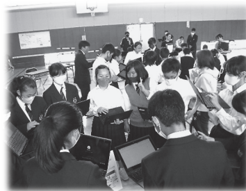
～ICTフル活用の生徒総会～