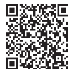
八丈町立図書館 ホームページ