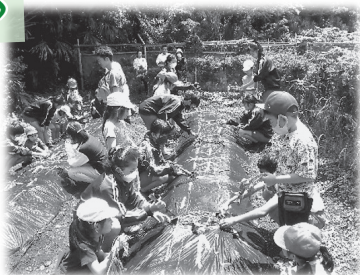
～かんも交流（大賀郷小2年）～