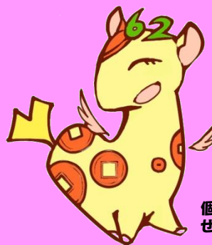
個人住民税PRキャラクター ぜいきりん

東京都と都内区市町村はオール東京で、平成29年度から原則として全ての事業主の方に、特別徴収義務者の指定を実施しますので、事業主の方は、ご理解・ご協力をお願いいたします。