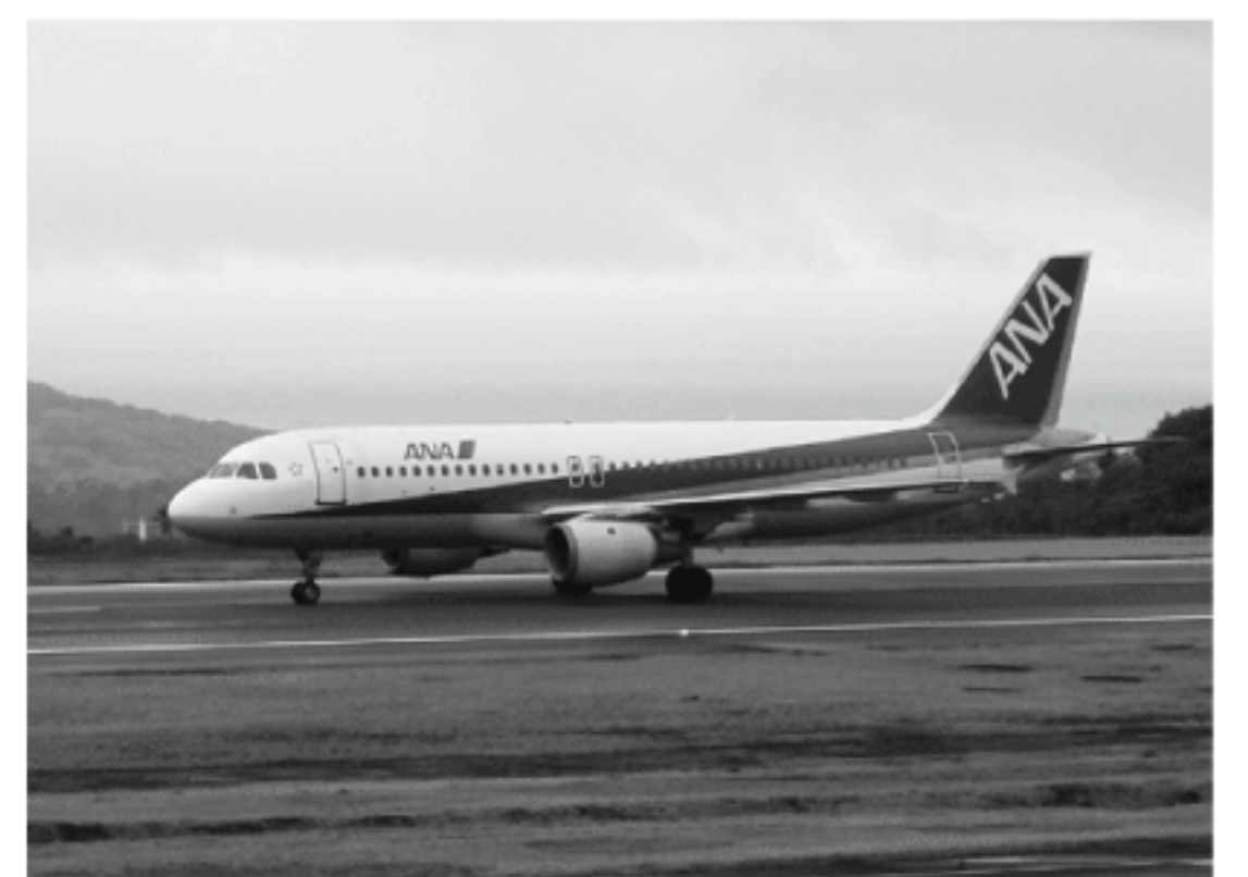
10月より大島経由便が廃止となる

質問 今秋には大島経由便がなくなり、観光産業に及ぼすイメージダウンは免れない。かつての一万円キャンペーンのような町独自の施策を打ち出すと同時に、今ある観光資源を整備する必要があると思うが、町の考えは。