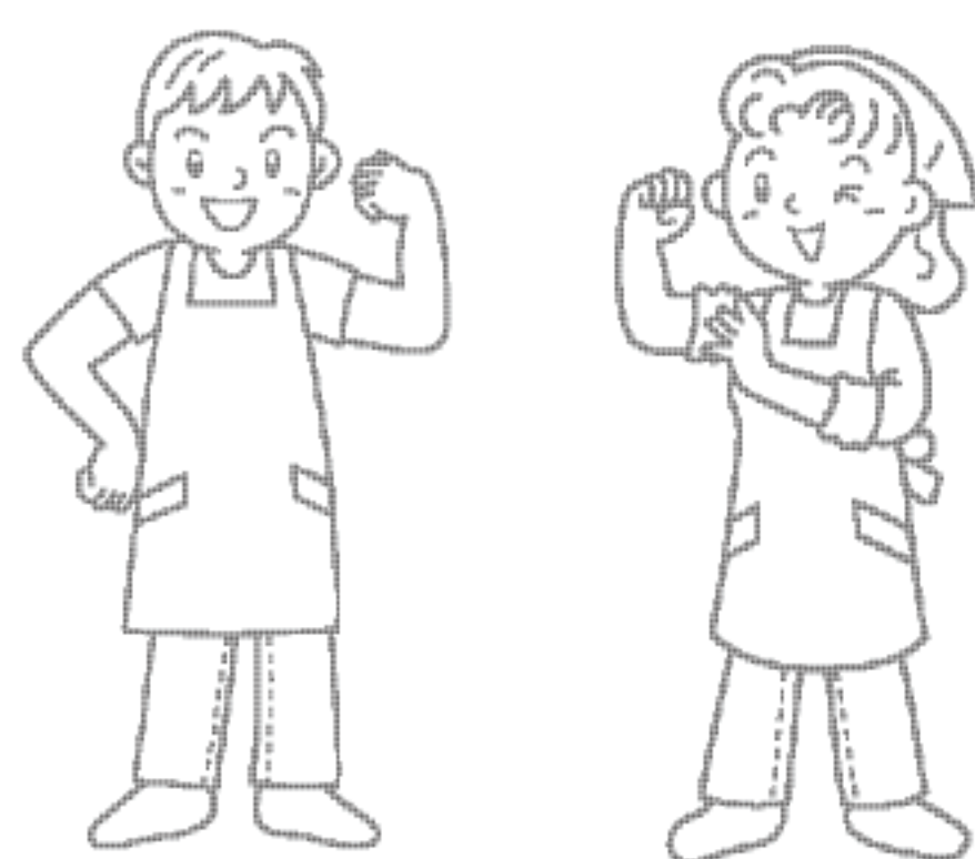
人に優しい町づくり

八丈町では現在、生活機能評価を健康診査の際に行い、生活機能の向上を図っている。「体力向上みんなで体操」という町独自の施策も実施し、高齢者を応援している。また、要介護等の認定者数に