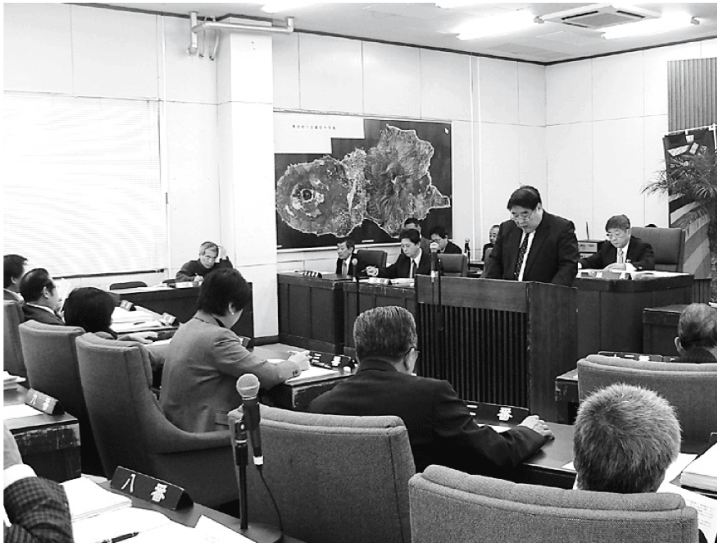
町長による施政方針演説（3月6日）

第一回八丈町議会定例会が3月6、23、25、30日の4日間、開催されました。 一般質問では、5名の議員が登壇しました。 また、これまで議会で何度も議論されてきた厳しいバス事業の経営状況については、特別委員会を設置し、コスト削減と効率的なサービスの再構築を目指していきます。