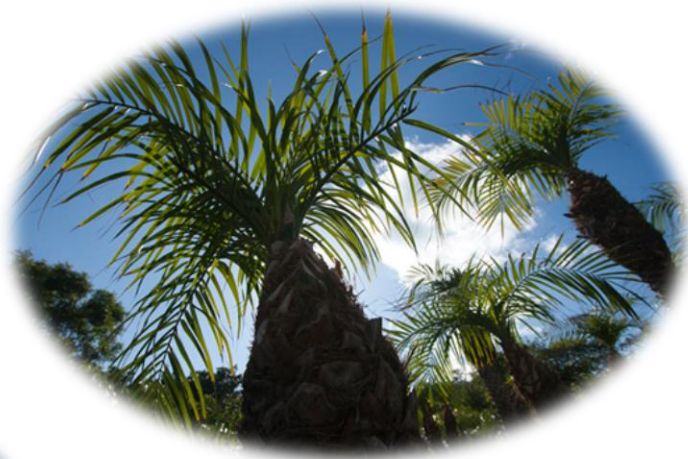
フェニックス・ロベレニー