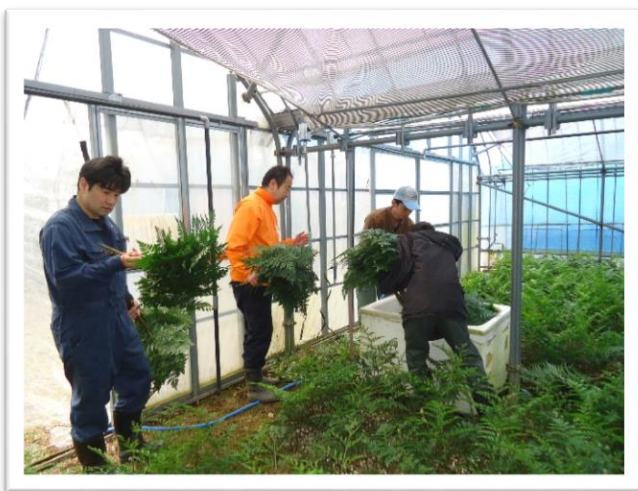
レザーファン研修

※その他、研修期間中に島外視察実施。 ※栽培実習作目は、変更になる可能性もあります。