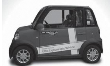
出展例 TAJIMA-JIAYUAN ※ダイヘン製ワイヤレス充電搭載