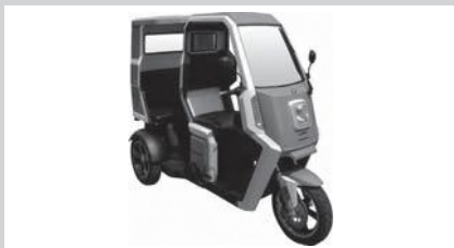
出展例 エース とことこAce