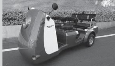
出展例 ライク・ピースリー Like-P3