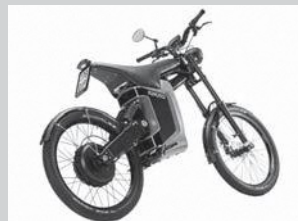
出展例 ELMOTO HR-2 (ELMOTO JAPAN)