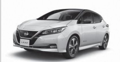
出展例 日産リーフ