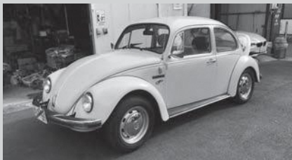
出展例 クラシックビートル コンバートEV