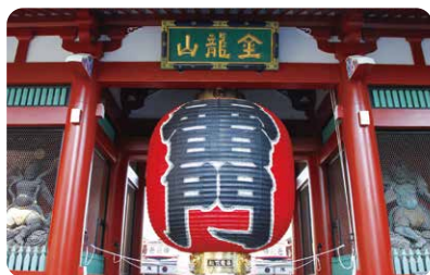
雷門(台東区・浅草寺風雷神門)