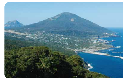
登龍峠からの眺望(八丈町・登龍峠展望)

●お問い合わせ先 ※本事業は東京都より株式会社大和田組に運営を委託しています。 ※電話受付時間9:00~17:00(土・日・祝日を除く。)