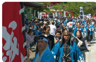
ひの新選組まつり(日野市・高幡山明王院金剛寺)